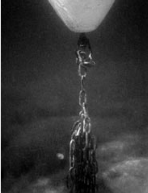
Abb. 2 Boje mit Bojenkette, die mit einem roten Lasthaken zusammengefasst wurde