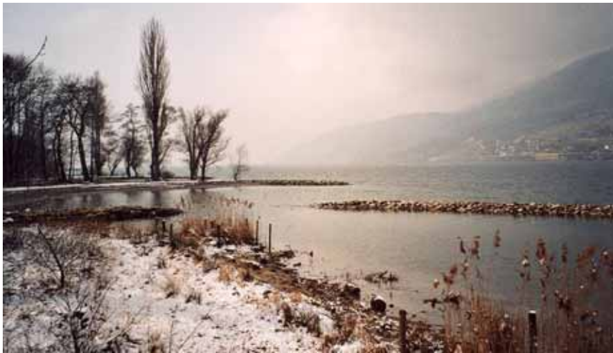
Abbildung 1: Renaturiertes Ufer am Bielsee (Erlenwäldli Ipsach)

Eines dieser Themen war der zumindest europaweit zu beobachtende Rückgang der aquatischen Röhrichte an Seeufern. Das Wirkungsgefüge, welches für die komplexen Prozesse dieser Entwicklung verantwortlich war, ist bis heute nicht restlos geklärt. Als direkte Folge des hohen Wissenstandes in der Limnologie wurde die Eutrophierung der Seen lange Zeit als hauptverantwortlicher Faktor für den Schilfrückgang betrachtet. Erst allmählich setzte sich die Erkenntnis durch, dass nicht nur chemisch-physiologische sondern neben anderen auch physikalisch-hydromorphologische Prozesse am Phänomen 'Schilfrückgang' massgeblich beteiligt waren. Dadurch entstand ein interdisziplinärer Zusammenhang zwischen Biologie und Wasserbau.