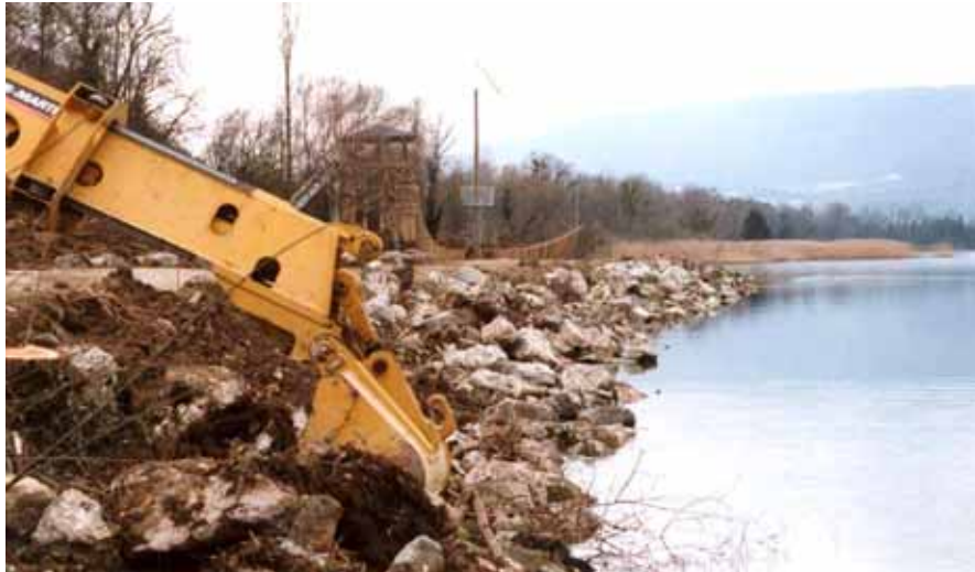
Abbildung 4: Rückbau eines Blockwurfs (Strandbad Erlach)

Unter diesen günstigen Voraussetzungen – die wachsende Sensibilität für die gesellschaftlichen und ökologischen Aspekte der Seeufer, das kantonale See- und Flussufergesetz sowie die eingetübte Rolle des VBS als regionaler Koordinator – konnte der Bielersee bezüglich des wasserbaulichen Umgangs mit seinen Ufern zum Modell werden.