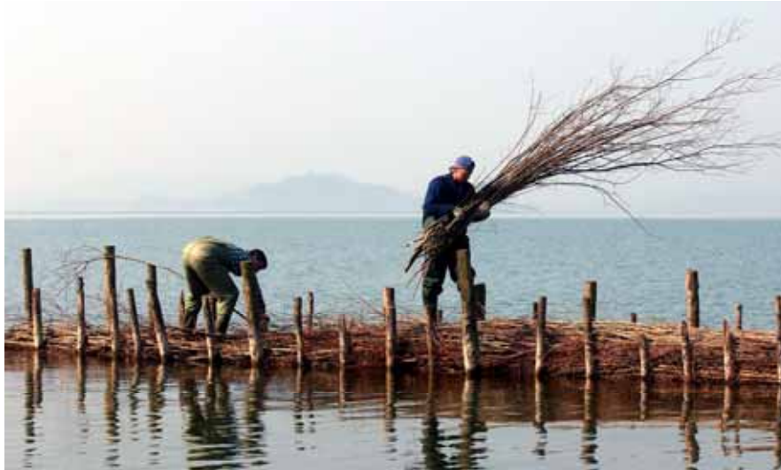
Abbildung 3: Bau einer Lahnung zum Schutz von Schilfbeständen (Mörigen)

Die Ufer des Bielersees, welche durch die Seespiegelsenkung Ende des 19. Jahrhunderts entstanden sind, wurden vorwiegend in der ersten Hälfte des 20. Jahrhunderts teilweise in aufwändiger Arbeit mit Blockwerk verbaut. Später sind nur noch einzelne Uferanpassungen wie z.B. in der Bieler Seebucht oder in La Neuveville (St. Joux) oder der Bau von Hafenanlagen, z.B. in Mörigen, Täuffelen und Erlach, realisiert worden. Alle diese Projekte bestanden aus Aufschüttungen von Seefläche und einer harten Verbauung der Uferlinie durch Blockwurf. Heute sind rund 40 % der Flachufer am Bielersee mit harten Massnahmen befestigt.