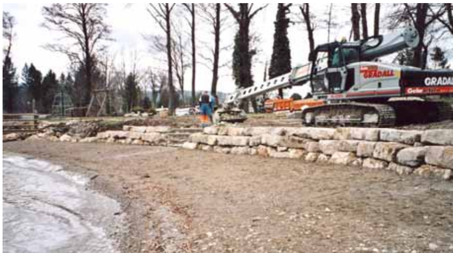
Abbildung 2: Aufwertung einer Badebucht durch Kies/Sand-Vorschüttung, kombiniert mit dem Schutz prähistorischer Kulturschichten durch Blocksatz (Strandplatz Sutz)

Wasserbau an Seeufern war bis vor kurzem mit dem Bau von Mauern oder Blocksatz gleichzusetzen. Er diente fast ausschliesslich der Gewinnung von Land und zu dessen Schutz vor Erosion. Im Unterschied zum Wasserbau an Fliessgewässern fand an den Seeufern bisher noch kaum ein Umdenken auf angepasstere und naturnähere Wasserbaumethoden statt, ja wurde Wasserbau überhaupt noch kaum methodisch aufgearbeitet. Eine Ausnahme bildet eine Publikation der Baudirektion des Kantons Bern von 1989 (Ingenieurgemeinschaft Iseli und Bächtold AG).