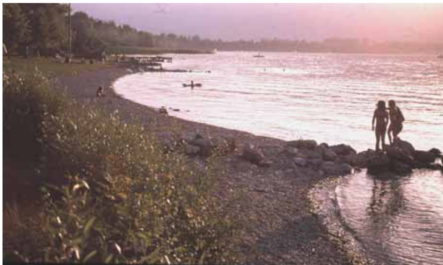
Abbildung 5: Neu gestalteter Seestrand (Strandbad Erlach)

Eine Zusammenstellung der in den Uferschutzplänen und Realisierungsprogrammen der Seegemeinden vorgesehenen Massnahmen ergibt nämlich, dass am Südufer des Bielersees auf einer gesamten Länge von rund 8 km Massnahmen zum Schutz, Wiederherstellung oder Umgestaltung von naturnahen Flachufern geplant waren. Davon wurden seit Beginn der Realisierungen 1987 bis heute ca. 3,7 km oder 45 % umgesetzt.