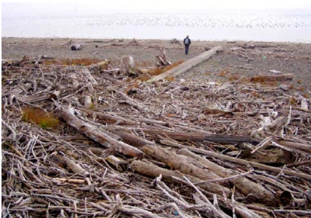
Abb. 3: Am bayerischem Bodenseeufer werden die Strandrasen von Unmengen angelandetem Treibholz zerstört.

nicht so gut entwickeln können wie die anderen Strandrasen-Arten. Einerseits können sich die Einzelpflanzen nur wenige Zentimeter pro Jahr ausbreiten. Andererseits scheint auch eine Fernausbreitung durch die aus den pseudoviviparen Rispen entstandenen Jungpflanzen nicht leicht möglich zu sein. Außerdem wurden – zumindest an einigen Stellen – in Niedrigwasserjahren auch schon Trockenschäden bei der Strand-Schmiele beobachtet.