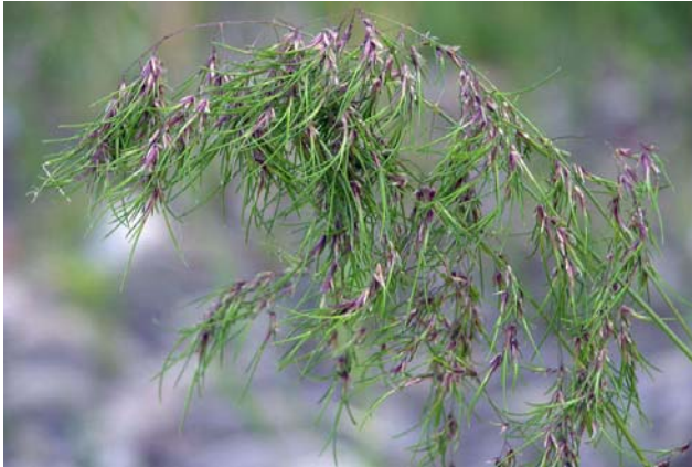
Abb. 2: Die Strand-Schmiele ist in den letzten 20 Jahren etwas zurück gegangen. Sie hat Probleme mit den extremen Wasserstandsschwankungen.

nicht so gut entwickeln können wie die anderen Strandrasen-Arten. Einerseits können sich die Einzelpflanzen nur wenige Zentimeter pro Jahr ausbreiten. Andererseits scheint auch eine Fernausbreitung durch die aus den pseudoviviparen Rispen entstandenen Jungpflanzen nicht leicht möglich zu sein. Außerdem wurden – zumindest an einigen Stellen – in Niedrigwasserjahren auch schon Trockenschäden bei der Strand-Schmiele beobachtet.