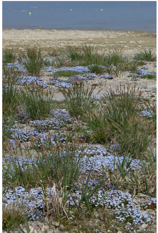
Abb. 1: Das Bodensee-Vergissmeinnicht hat sich in den letzten Jahren positiv entwickelt. Aber noch ist das ursprüngliche Blaue Band nur selten zu sehen.

Die insgesamt positive Entwicklung kann dadurch erklärt werden, dass die sinkenden Wasserstände eine Ausbreitung in Richtung See ermöglichten. Andererseits haben sicherlich auch die verstärkten Schutzbemühungen seit den 1980er Jahren mit gezielter Information und Pflegemaßnahmen dazu beigetragen.