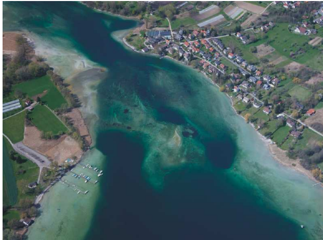
Abb. 2: Luftbild Stiegener Enge. Der Orkopf befindet sich in der Bildmitte.

wasser trockenfallende, aus krustigen Kalkkongregationen aufgebaute Seichtstellen. Im ersten Viertel des 20. Jh. waren diese Kalkbänke noch wohl bekannt und für die Landschaft und Hydrologie der beiden Seeausflüsse offenbar geradezu landschaftsprägend. Sie erstreckten sich vom „Alentrain“ im Konstanzer Trichter rheinabwärts bis nach Gottlieben und vom „Orkopf“ in der Stiegener Enge (Abb. 2) bis unterhalb Stein am Rhein (WEGELIN 1915, 76f; BAUMANN 1915, 175f).