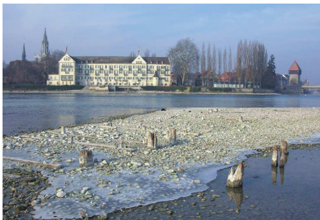
Abb. 1: Fundamente der Rheinmühlen am „Alentrain“ unmittelbar vor der Alten Rheinbrücke in Konstanz.

Die beiden Abflussschwellen des Bodensees sind seit Jahrhunderten menschlichen Eingriffen ausgesetzt gewesen. In der Konstanzer Schwelle – dem Ausfluss des Obersees in den Seerhein und den Untersee – waren es vor allem das stetige Vorrücken der Stadt in die Flachwasserzone sowie Brücken- und Mühlkonstruktionen (RÖBER 2011, 86f), die die Querschnittsprofile veränderten und zu massiven Veränderungen der Hydrologie führten. Ausgeglichen wurden diese Maßnahmen teilweise zunächst noch durch die Schanzgräben der mittelalterlichen Stadt, die zusätzliche Abflüsse in Richtung Untersee schufen. Als diese außer Gebrauch kamen und zugeschüttet wurden, musste die Zahl der Schadhochwasser steigen. Der Brand der Konstanzer Rheinbrücke 1856 wurde vor diesem Hintergrund zu einem Politikum, das in eine internationale Vereinbarung mündete. Die Herstellung von Stauwehren bei Konstanz war danach nicht mehr gestattet (SOMMER 1922, 3f).