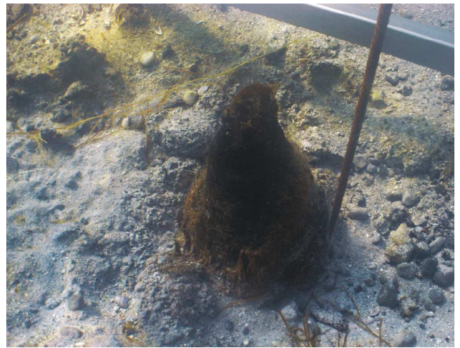
Abb. 5: Pfahl Konstanz/Frauenpfahl

analytische Analyse erbrachte klare Hinweise auf eine Entstehung dieser Ablagerung im Präboreal, also um etwa 8000 v. Chr. (frdl. Mitteilung M. Rösch, Archäobotanisches Labor d. Arbeitsstelle Hemmenhofen des Landesamtes f. Denkmalpflege). Die Krusten selbst waren wegen ihrer porös-inhomogenen Konsistenz nicht sicher zu datieren; aus pollenanalytischer Sicht lässt sich nur festhalten, dass sie, in Übereinstimmung mit dem stratigraphischen Befund, sicherlich jünger als die Seekreideablagerungen des Orkopf sind.