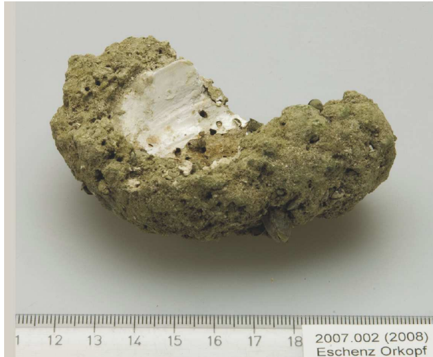
Abb. 3: Kalktuffbrocken vom Orkopf, Stiegen / Eschenz. Im Innern befand sich offenbar einmal eine Muschel.

ßenden Schienerberg beschrieben worden sind (GÖTLICH & KLÖTZLI 1975, 44f). 2013 aber trafen wir dann am nördlichen Rand des neolithischen Pfahlfeldes auf mit der Kelle kaum zu durchdringende, zusammenhängende, harte Krusten.