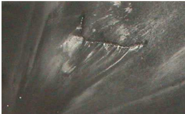
Abb. 2: Ausschnitt aus einem Luftbild

änderung. Er wirkt dadurch wie eine Stromschnelle, in der sich die Strömungsgeschwindigkeit besonders bei Niedrigwasser beträchtlich erhöht.